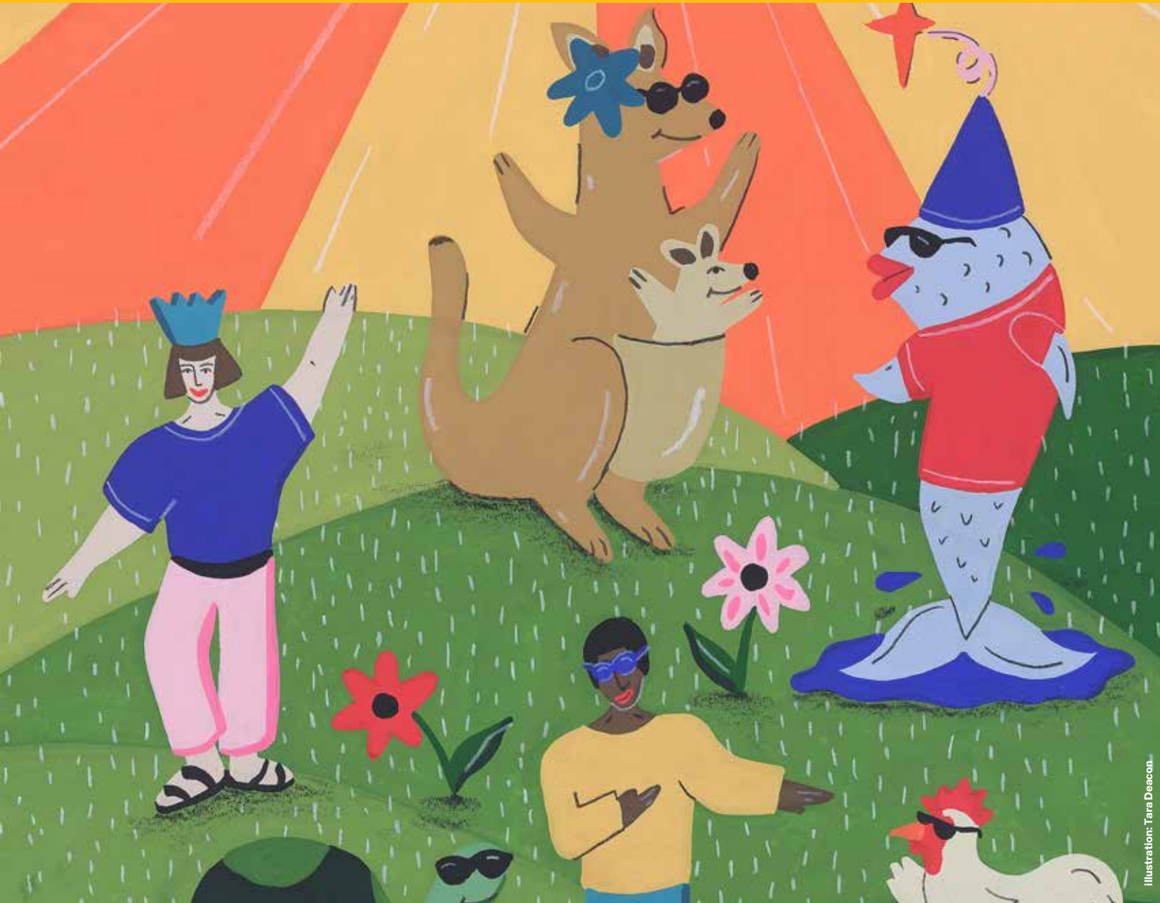
Illustration: Tara Deacon

Sans paroles / ohne Worte / without words