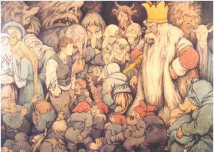
Theodor Kittelsen, Peer Gynt dans l'antre du roi de la montagne , 1913

héros au rythme d'une danse indiquée alla marcia . Un unique thème est énoncé à de multiples reprises, selon le principe de l'élargissement progressif à tous les instruments, ce à quoi s'ajoutent un grand crescendo et une accélération finale, suscitant le plus bel effet et formant idéale conclusion à ces quelques extraits de la musique imaginée par Grieg pour le héros d'Ibsen.