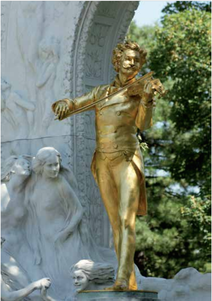
Das Johann-Strauß-Denkmal im Wiener Stadtpark Edmund Hellmer, 1921