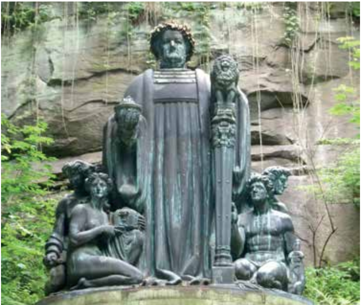
Richard-Wagner-Denkmal im Liebethaler Grund bei Dresden Richard Guhr, 1911/12

und Musiker aber durchaus anspruchsvoll zu spielen. Die Besonderheiten der Spielkultur eines Wiener Walzers gelingen dabei nicht immer wie in Wien (die nachschlagenden Zählzeiten des Dreiers erklingen nicht streng im Takt). Eine Vielzahl an Charakteren und die relativ kurze Spieldauer lassen sie besonders geeignet erscheinen für Nummernprogramme, die sich – bei Rundumschau der Orchesterlandschaft – vor allem zu Silvester, zu Neujahr und zum Saisonabschluss anbieten. Offensichtlich gelten gerade zum Jahreswechsel andere Grundsätze der Programmgestaltung, so wird beispielsweise zu Silvester die Fledermaus von Johann Strauß (Sohn) an der Wiener