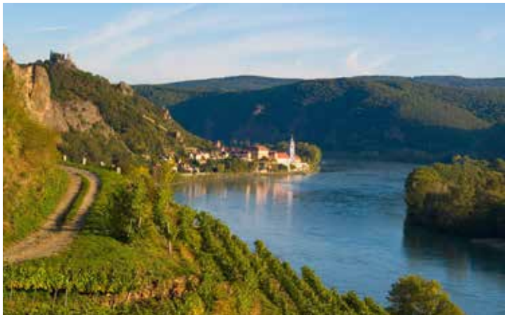
Paysage dans la vallée du Danube

Du Beau Danube bleu ( An der schönen blauen Donau ), il est sans doute inutile de dire quoi que ce soit, que la musique ne dise elle-même – magnifique hommage de Johann Strauss fils à l'immense fleuve dont d'innombrables touristes s'obstinent depuis à chercher la couleur attendue, et qu'ils ne trouvent jamais... La valse est une succession de thèmes plus beaux, lyriques et animés les uns que les autres. Elle est toujours placée, dans la tradition viennoise du Concert de Nouvel An télédiffusé aujourd'hui dans le monde entier depuis le Musikverein de Vienne, juste après ce moment très attendu des vœux, exprimés en chœur par les musiciens de l'Orchestre