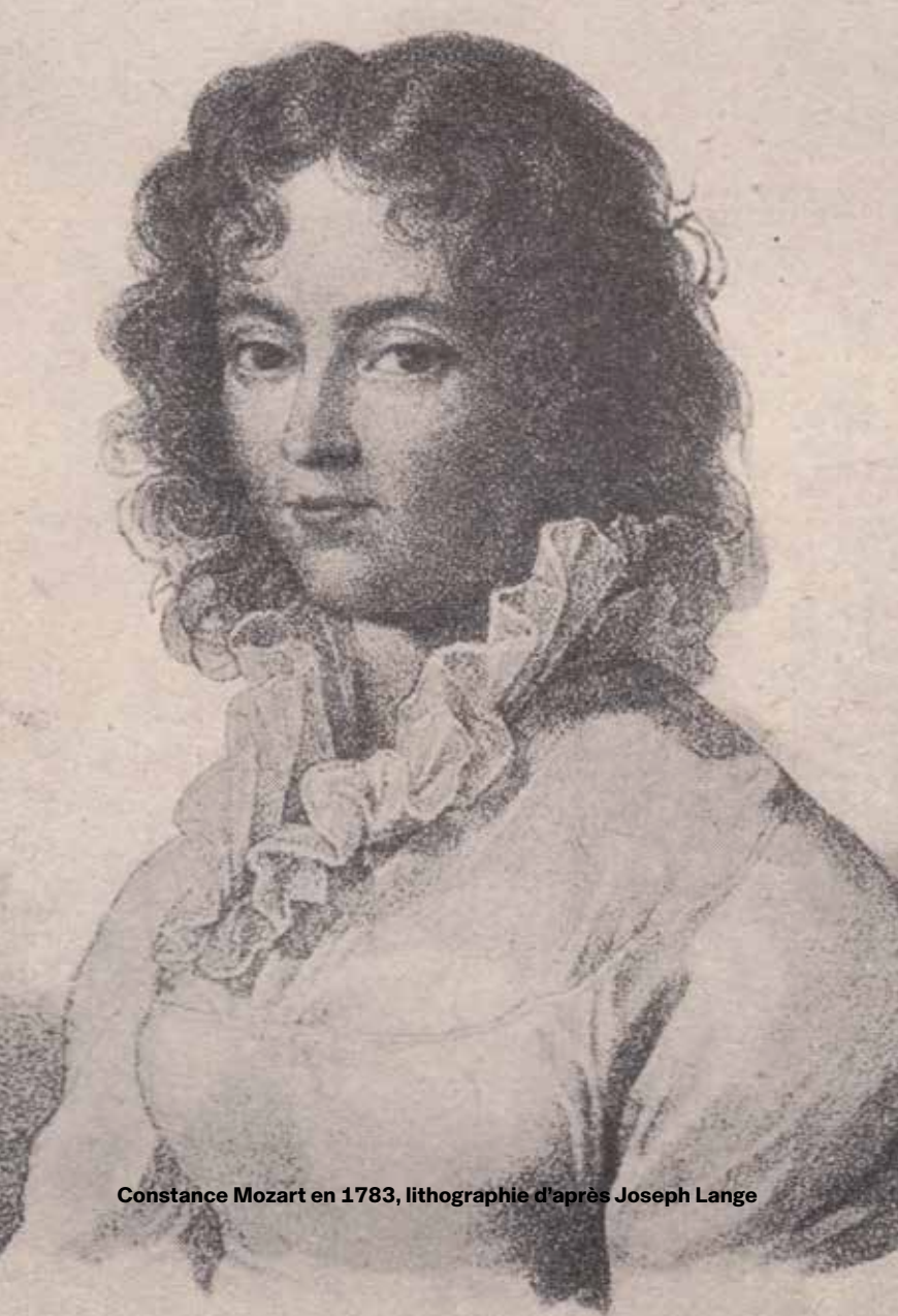
Constance Mozart en 1783, lithographie d'après Joseph Lange